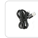
Cable de datos