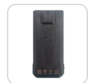
Batería de Li-Ion 1500 mAh