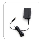
Adaptador de energía 12 V/1 A