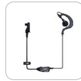
Auriculares tipo C