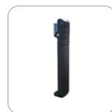
Clip para el cinturón