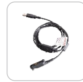
Cable de programación PC155